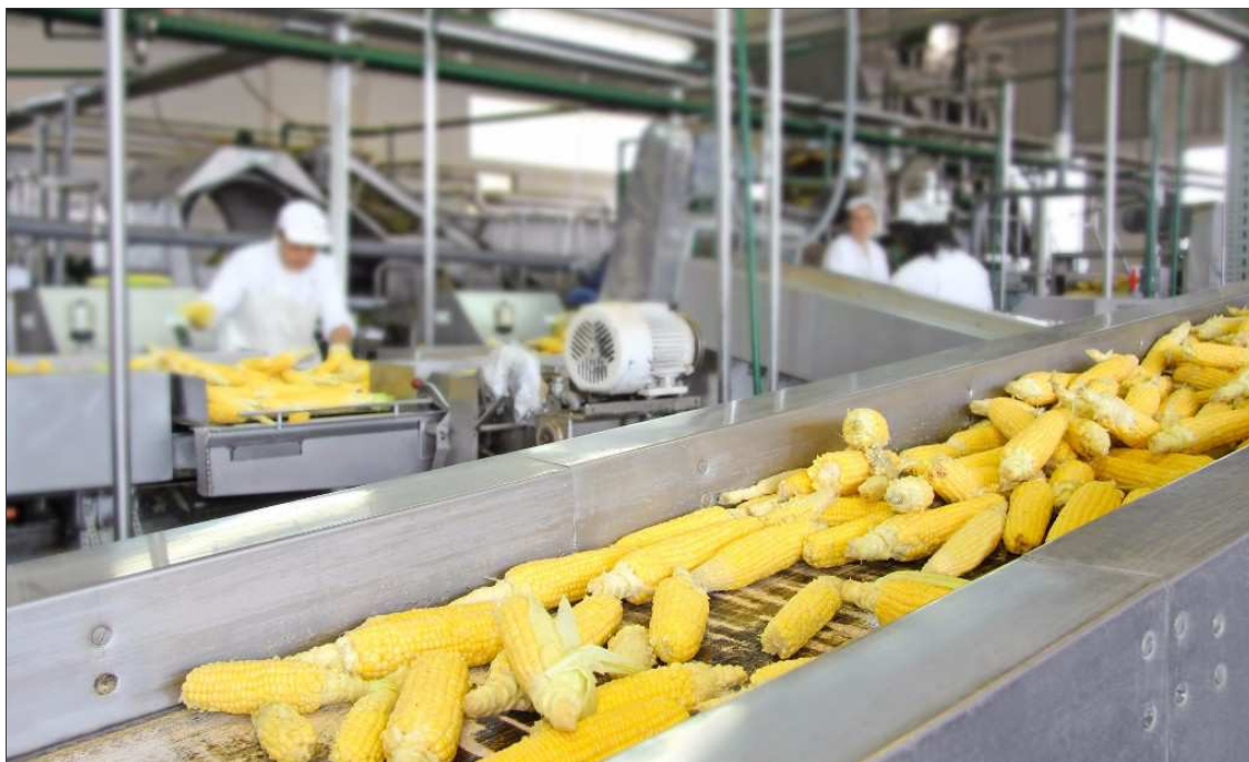
Élelmiszeripari komplex beruházások támogatása

Megnyílt az Élelmiszeripari komplex beruházások támogatása felhívás, amely vissza nem térítendő támogatás és hitel kombinációját kínálja. Figyelem! Ebben a felhívásban azok a társaságok is nyújthatnak be pályázatot, akik a mezőgazdasági termékek elsődleges feldolgozását végzik, és így a korábbi pályázatokon nem tudtak indulni!