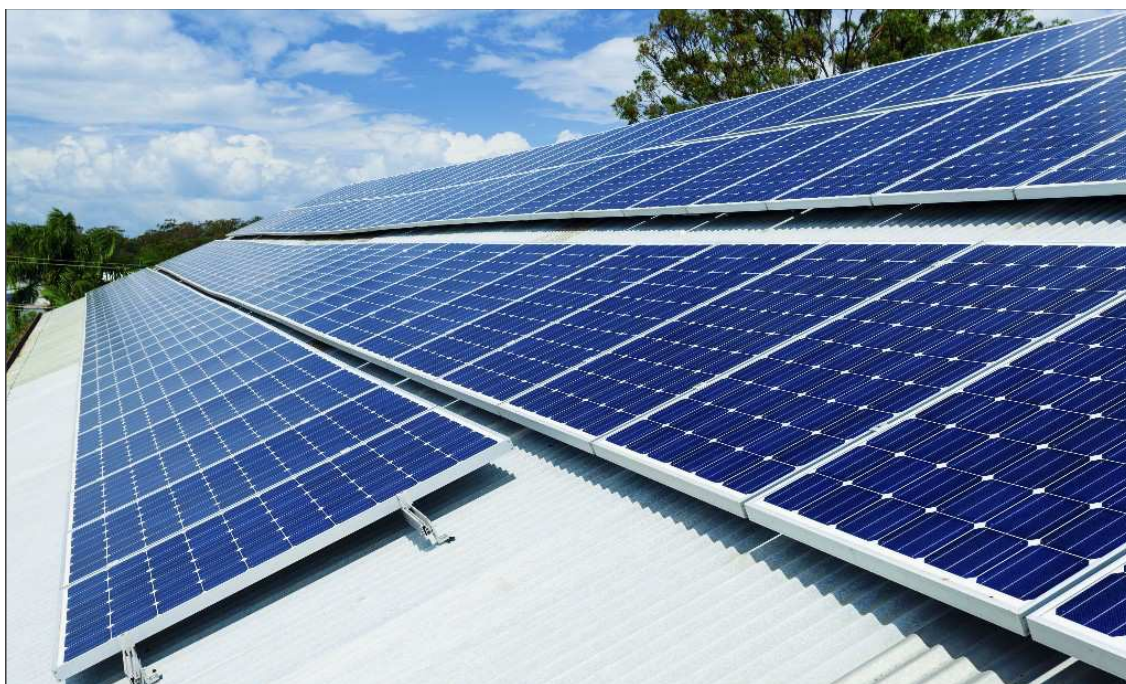
Épületenergetikai fejlesztések támogatása

A felhívás vissza nem térítendő támogatás és kölcsön formájában hozzájárul az épületek energiatakarékosságának és energiahatékonyságának megújuló energiaforrások felhasználásával történő javítására irányuló beruházások megvalósításához.