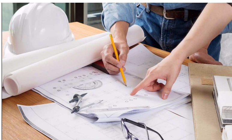
Mikro-, kis-, és középvállalkozások K+F+I tevékenységének ösztönzése

A hitelprogram célja a Közép-magyarországi régió kívül elhelyezkedő mikro-, kis-, és középvállalkozások K+F+I tevékenységének ösztönzése, saját tevékenységi körében végzett olyan prototípus, termék-, technológia- és szolgáltatásfejlesztési tevékenységek támogatása, amelyek jelentős szellemi hozzáadott értéket tartalmazó új, piacképes termékek, szolgáltatások, technológiák, ill. ezek prototípusainak kifejlesztését, piacra vitelét eredményezhetik.