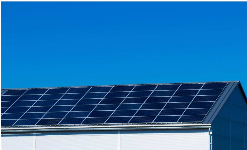
Épületenergetikai fejlesztések a Közép-magyarországi régióban

Hosszabb várakozás előzte meg a Közép-magyarországi régióban megjelent felhívást, amely vissza nem térítendő támogatás és kedvezményes kamatozású hitel formájában hozzájárul az épületek energiatakarékosságának és energiahatékonyságának megújuló energiaforrások felhasználásával történő javításához, az ehhez szükséges beruházások megvalósításához.