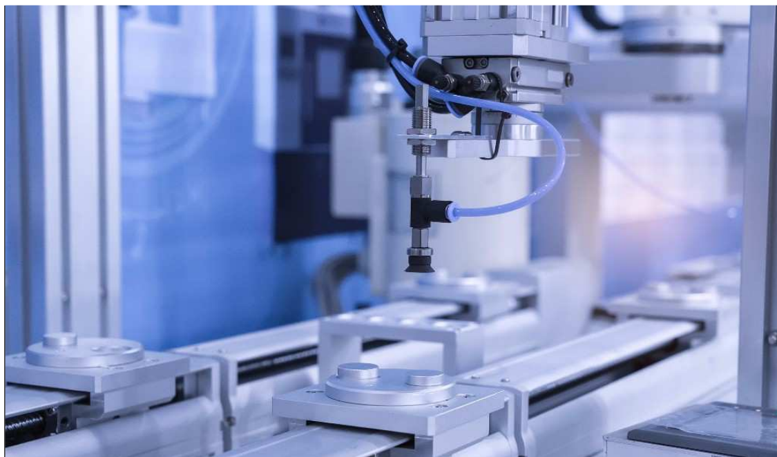
Mikro-, kis- és középvállalkozások kapacitásbővítő beruházásainak támogatása

A felhívás célja a KKV-k fejlődésének, gazdaságban betöltött szerepének, piaci pozíciójának erősítése, munkahelyek megtartását eredményező beruházások támogatása, a területi különbségek csökkentése, a térségi felzárkóztatás és a helyi gazdaság megerősítése.