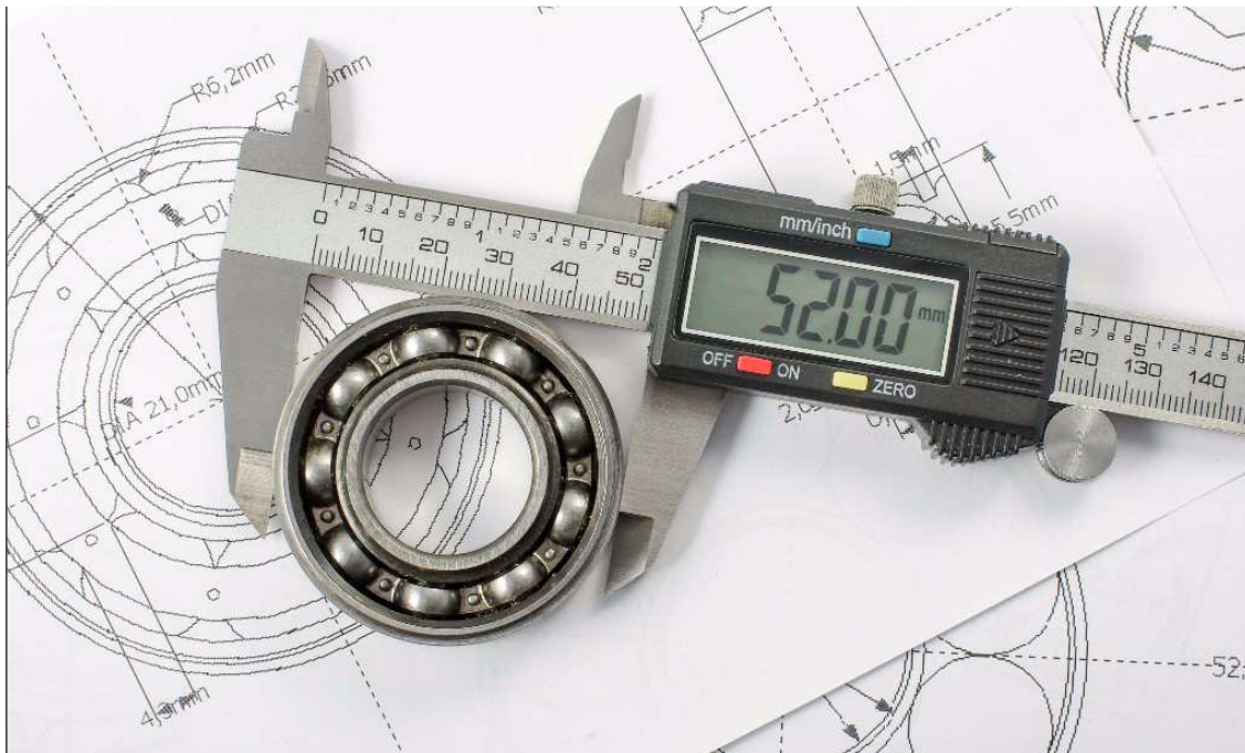
Prototípus, termék-, technológia- és szolgáltatás fejlesztés

A vállalatok önálló K+F+I tevékenységének támogatása érdekében megjelent felhívás vissza nem térítendő támogatás és kedvezményes kamatozású hitel kombinációját tartalmazza. A felhívásban biztosított konstrukció az innovatív vállalkozások házon belüli prototípus, termék-, technológia- és szolgáltatás fejlesztéséhez biztosít ideális forrást. A támogatást mikro-, kis-, és középvállalkozások, illetve nagyvállalatok vehetik igénybe.